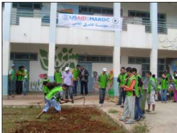
Figure 3: journée environnementale

Le projet a également organisé des activités qui ont favorisé les concepts du travail en équipe et la responsabilité civique. Un exemple de ces activités est une campagne de sensibilisation à l'environnement initiée par un comité de jeunes à Sidi Moumen. La campagne comprenait un