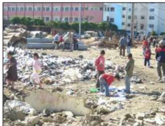
Figure 1: Les jeunes à Thomas.

La vie sociale dans le périurbain et dans les bidonvilles de Casablanca se caractérisent par la pauvreté, le chômage, l'exclusion sociale, la drogue, la criminalité, et un manque d'accès à un logement viable, le manque d'infrastructures, de la formation et des services. Des organismes fondamentalistes tirent profit de cette situation pour inciter les jeunes à prendre des positions violentes et radicales en présentant des services sociaux et économiques à ces communautés sous prétexte de combler les lacunes des programmes de l'Etat. En effet, les kamikazes qu'ont connus les rues de Casablanca en 2003 et 2007 comptaient parmi eux des jeunes de Sidi Moumen, l'un des plus célèbres et le plus grand bidonville de la ville. Beaucoup attribuent la participation des jeunes à ces attentats à l'influence des groupes extrémistes qui se présentent comme sauveurs des jeunes de cette situation.